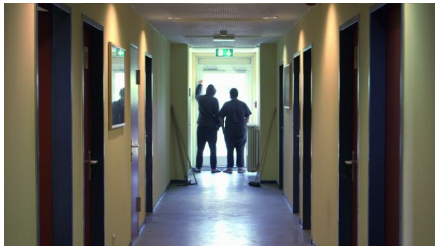
Trailer "Gefängnis ohne Zaun und Gitter"